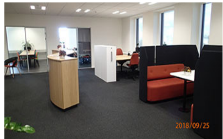
Her vil vi møde jer.