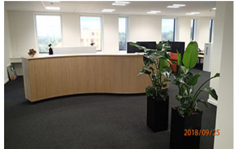
Dette er ankomst til kontoret

Adressen er: Kolding Åpark 8A 4 øst 6000 Kolding (oven over Sydbank i Design City).